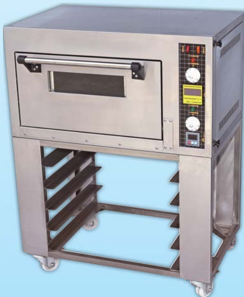
桌上型電烤箱 TYE005L-M 外徑 External Size W79×D50×H103cm 內徑 Baking Chamber Size W54.5×D36.5×H21.5cm 用電量 Power Consumption 2.5KW