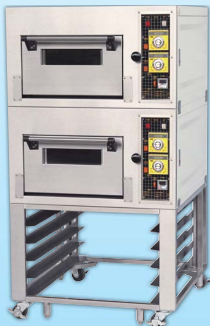
二層二盤 電烤箱 TYE202L-E 外徑 External Size W87×D95×H158cm 內徑 Baking Chamber Size W48×D76×H20cm 用電量 Power Consumption 7KW