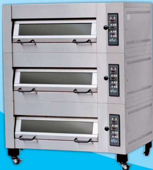
上掀式三層 六盤電烤箱 TYE306U-C 外徑 External Size W140xD104xH175cm 內徑 Baking Chamber Size W97xD76xH20cm 用電量 Power Consumption 18KW