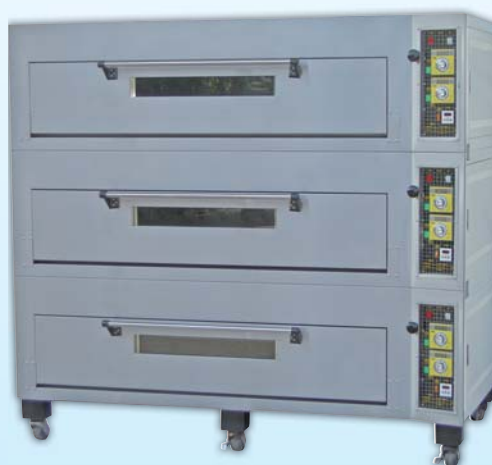
三層九盤電子 瓦斯烤箱

外徑 External Size W189×D104×H175cm 內徑 Baking Chamber Size W146×D76×H20cm 瓦斯消耗量 Gas Consumption 1.0KG/H