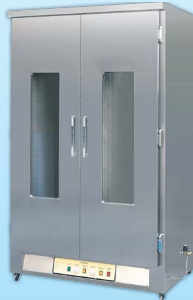
雙門傳統 發酵箱 TYF236B-M 外徑 External Size W120×D85×H204cm 用電量 Power Consumption 2.2KW