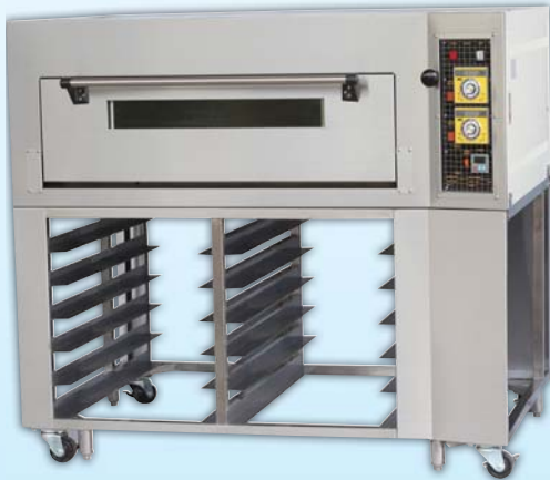
一層二盤 電烤箱 TYE102L-E 外徑 External Size W140×D100×H122cm 內徑 Baking Chamber Size W97×D76×H20cm 用電量 Power Consumption 6KW