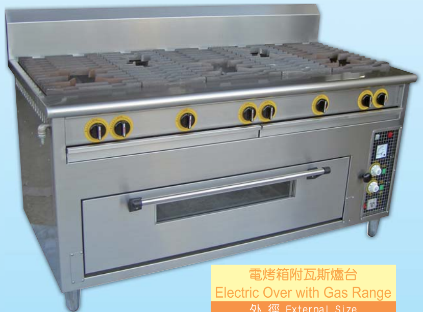
電烤箱附瓦斯爐台 Electric Over with Gas Range 外徑 External Size W151xD75xH95cm 內徑 Baking Chamber Size W104xD53xH20cm 用電量 Power Consumption 10KW