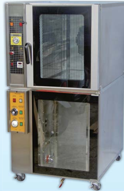
電熱型 熱風烤箱 TYT106F-E

外徑 External Size W78xD103xH152cm 內徑 Baking Chamber Size W41xD61xH56cm 用電量 Power Consumption 13.2KW/18KW