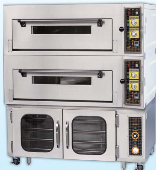
二層四盤 電烤箱 TYE204F-E 外徑 External Size W140×D100×H158cm 內徑 Baking Chamber Size W97×D76×H20cm 用電量 Power Consumption 14KW