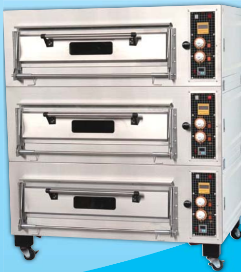
三層六盤 凸面電烤箱 TYE306C-M 外徑 External Size W140×D95×H165cm 內徑 Baking Chamber Size W97×D76×H20cm 用電量 Power Consumption 18KW