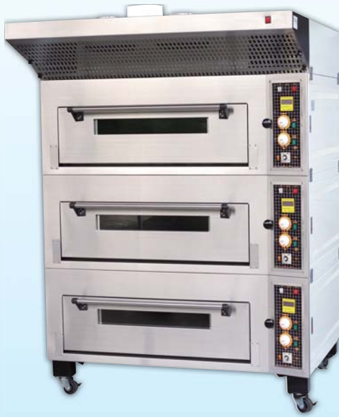
三層六盤 電烤箱 TYE306P-M 外徑 External Size W140×D134×H191cm 內徑 Baking Chamber Size W97×D76×H20cm 用電量 Power Consumption 18KW