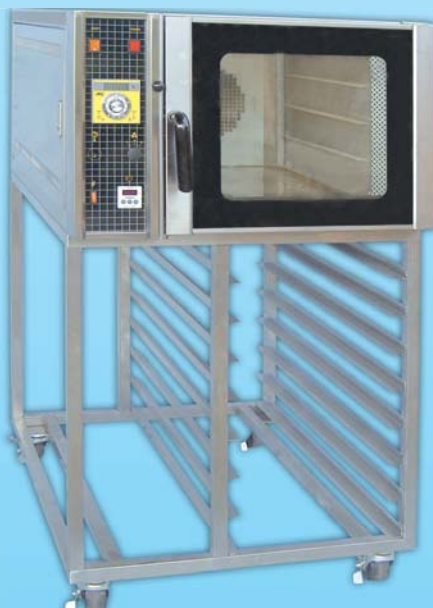
電熱型 熱風烤箱 TYT104L-E

外徑 External Size W78xD103xH68.5cm 內徑 Baking Chamber Size W41xD61xH56cm 用電量 Power Consumption 6.6KW/9KW