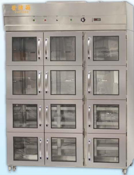
十二門噴霧 發酵箱 TYF1224A-M 外徑 External Size W160×D99×H224cm 用電量 Power Consumption 2.4KW