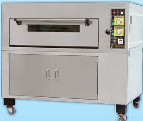
一層二盤 電烤箱 TYE102K-E 外徑 External Size W140×D100×H122cm 內徑 Baking Chamber Size W97×D76×H20cm 用電量 Power Consumption 6KW