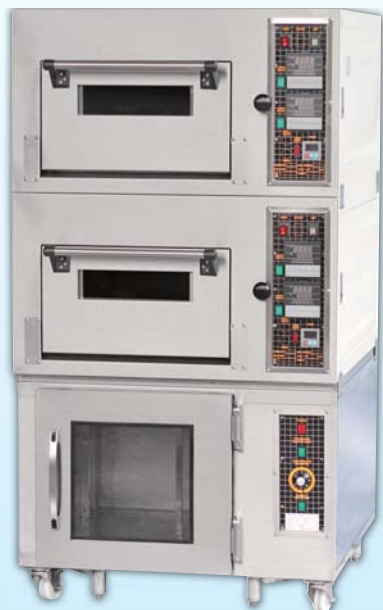
二層二盤 電烤箱 TYE202F-C 外徑 External Size W87×D95×H158cm 內徑 Baking Chamber Size W48×D76×H20cm 用電量 Power Consumption 8KW