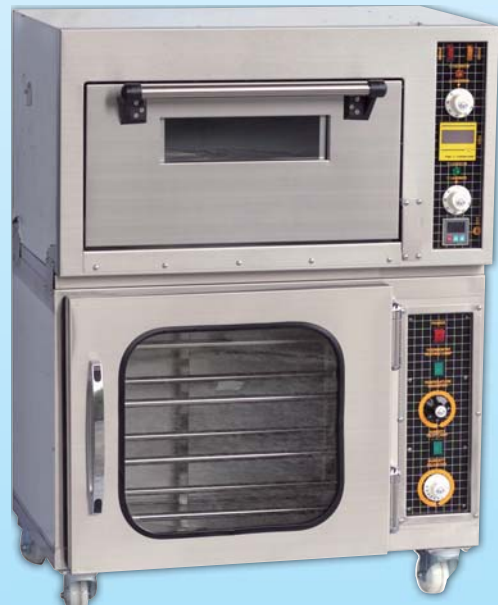
桌上型電烤箱 TYE005F-M 外徑 External Size W79×D50×H103cm 內徑 Baking Chamber Size W54.5×D36.5×H21.5cm 用電量 Power Consumption 4.5KW