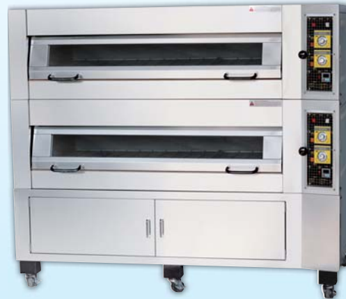
上掀式二層 六盤電烤箱 TYE206UK-E 外徑 External Size W189xD104xH168cm 內徑 Baking Chamber Size W146xD76xH20cm 用電量 Power Consumption 18KW