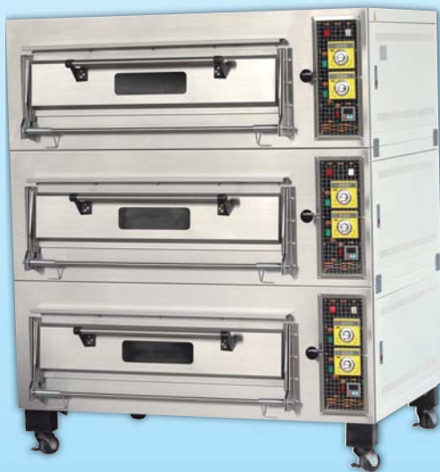
三層六盤 凸面電烤箱 TYE306C-E 外徑 External Size W140×D95×H165cm 內徑 Baking Chamber Size W97×D76×H20cm 用電量 Power Consumption 18KW