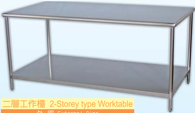
二層工作檯 2-Storey type Worktable 外徑 External Size 90x180x85cm