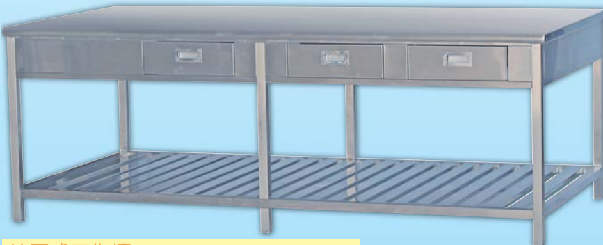
抽屜式工作檯 Worktable with drawers 外徑 External Size 115x232x85cm