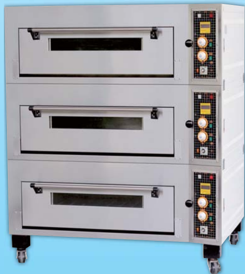
三層六盤 電烤箱 TYE306-M 外徑 External Size W140×D100×H165cm 內徑 Baking Chamber Size W97×D76×H20cm 用電量 Power Consumption 18KW