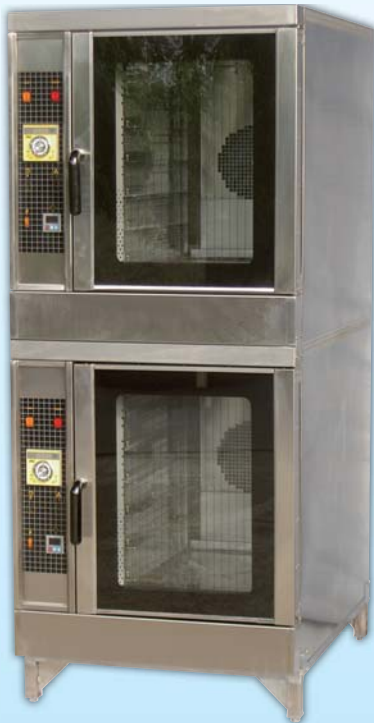
雙層瓦斯型 熱風烤箱 TYTG212-E 外徑 External Size W78xD103xH184cm 內徑 Baking Chamber Size W41xD61xH56cm 用電量 Power Consumption 2HP