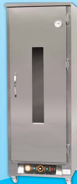
單門傳統 發酵箱 TYF118B-M 外徑 External Size W72×D85×H224cm 用電量 Power Consumption 2.2KW