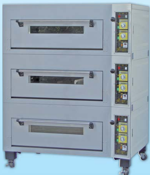
三層六盤電子 瓦斯烤箱

外徑 External Size W189×D100×H175cm 內徑 Baking Chamber Size W146×D76×H20cm 瓦斯消耗量 Gas Consumption 1.0KG/H