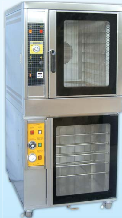
瓦斯型 熱風烤箱 TYTG106F-E 外徑 External Size W78xD103xH174cm 內徑 Baking Chamber Size W41xD61xH56cm 用電量 Power Consumption 1HP/2KW