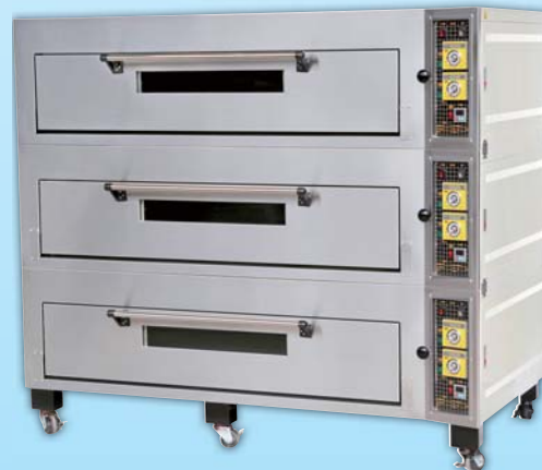
三層九盤 電烤箱 TYE309-E 外徑 External Size W189xD100xH165cm 內徑 Baking Chamber Size W146xD76xH20cm 用電量 Power Consumption 27KW