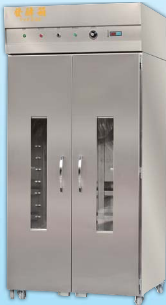
雙門噴霧 發酵箱 TYF236A-M 外徑 External Size W103×D99×H224cm 用電量 Power Consumption 2.2KW