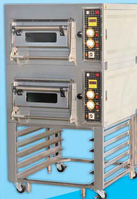
二層二盤 凸面電烤箱 TYE202CL-M 外徑 External Size W87×D95×H158cm 內徑 Baking Chamber Size W48×D76×H20cm 用電量 Power Consumption 7KW