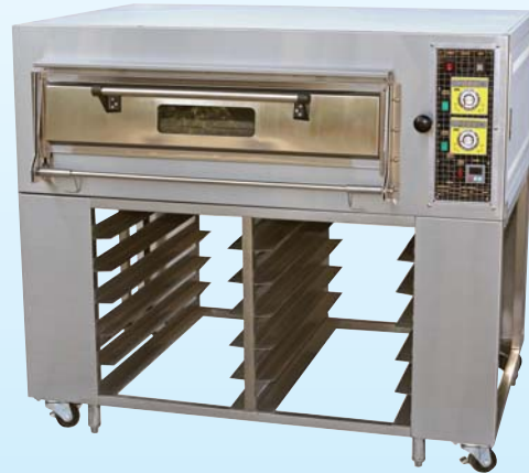
一層二盤凸面 電烤箱 TYE102CL-E 外徑 External Size W140×D95×H122cm 內徑 Baking Chamber Size W97×D76×H20cm 用電量 Power Consumption 6KW