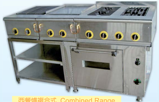
西餐爐複合式 Combined Range 外徑 External Size W151xD75xH80/95cm