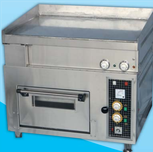
電烤箱附煎台 Electric Over with Griddle 外徑 W86xD95xH80/90cm 內徑 W48xD76xH20cm 用電量 8KW