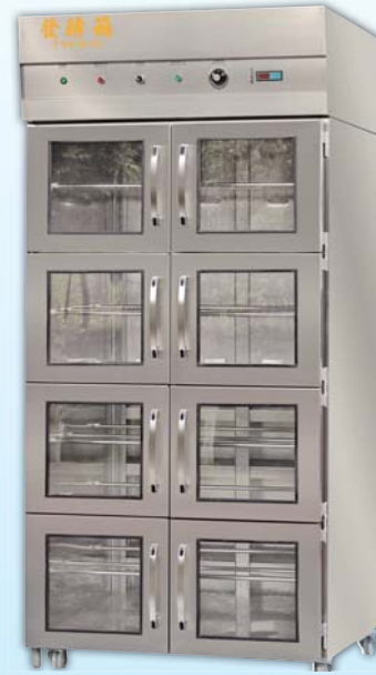
八門噴霧 發酵箱 TYF816A-M 外徑 External Size W103×D99×H224cm 用電量 Power Consumption 2.2KW