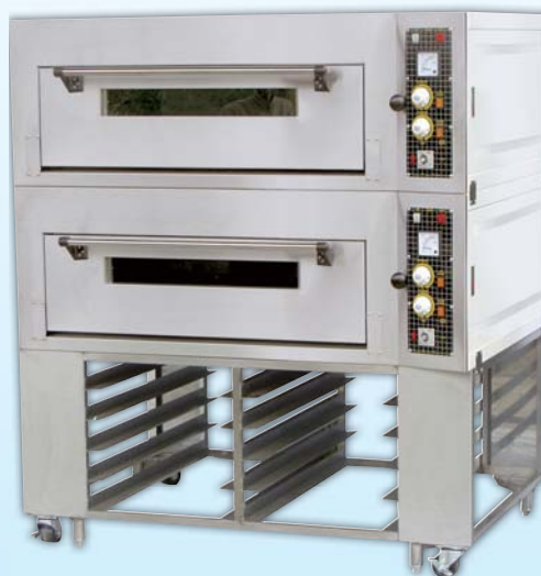
二層四盤 電烤箱 TYE204L-M 外徑 External Size W140×D100×H158cm 內徑 Baking Chamber Size W97×D76×H20cm 用電量 Power Consumption 12KW