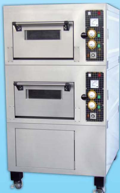
二層二盤 電烤箱 TYE202K-M 外徑 External Size W87×D95×H158cm 內徑 Baking Chamber Size W48×D76×H20cm 用電量 Power Consumption 7KW