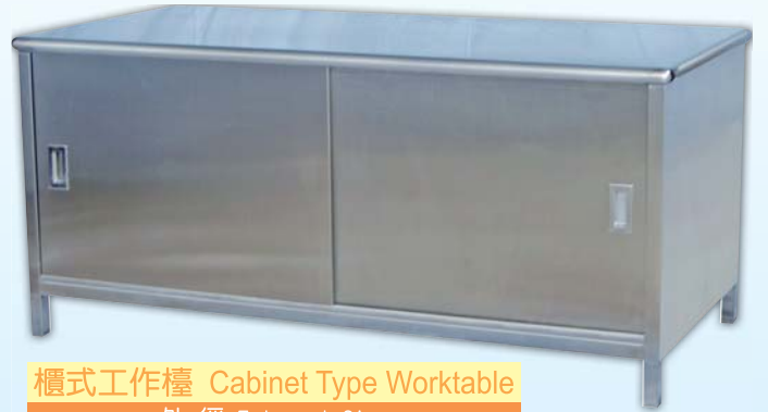
櫃式工作檯 Cabinet Type Worktable 外徑 External Size 90x210x85cm