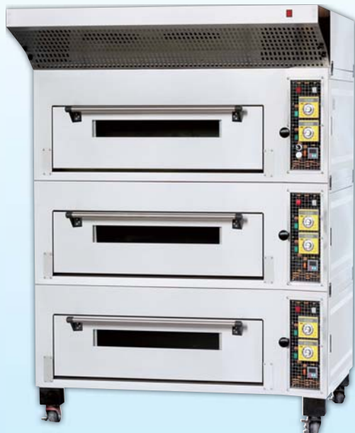
三層六盤 電烤箱 TYE306P-E 外徑 External Size W140×D134×H191cm 內徑 Baking Chamber Size W97×D76×H20cm 用電量 Power Consumption 18KW