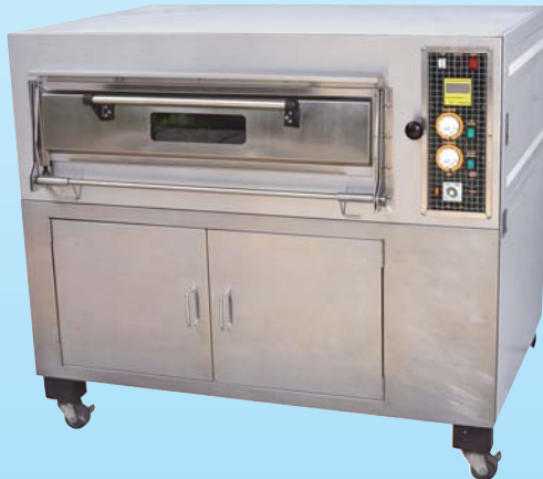
一層二盤凸面 電烤箱 TYE102CK-M 外徑 External Size W140×D95×H122cm 內徑 Baking Chamber Size W97×D76×H20cm 用電量 Power Consumption 6KW