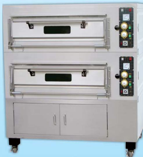
二層四盤 凸面電烤箱 TYE204CK-E 外徑 External Size W140×D95×H158cm 內徑 Baking Chamber Size W97×D76×H20cm 用電量 Power Consumption 12KW