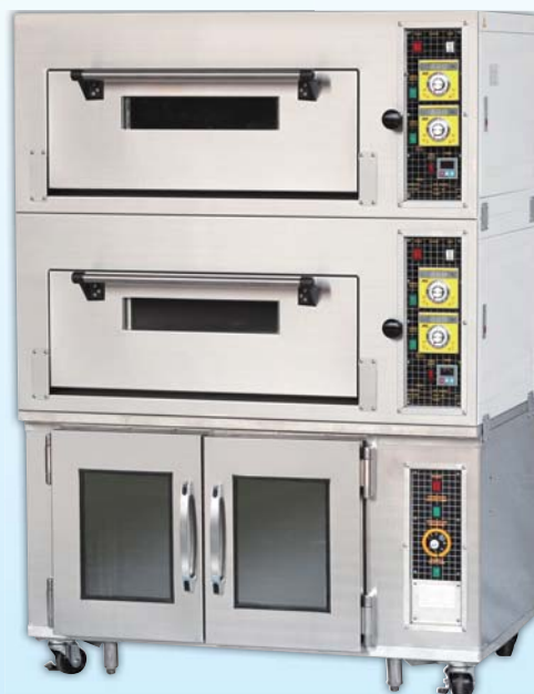
二層二盤 電烤箱 TYE202F-E 外徑 External Size W116×D67×H158cm 內徑 Baking Chamber Size W76×D48×H20cm 用電量 Power Consumption 8KW