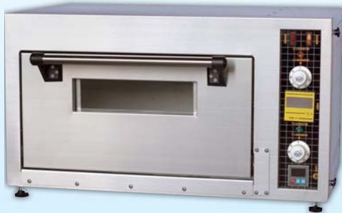
桌上型電烤箱 TYE005-M 外徑 External Size W79×D50×H43cm 內徑 Baking Chamber Size W54.5×D36.5×H21.5cm 用電量 Power Consumption 2.5KW