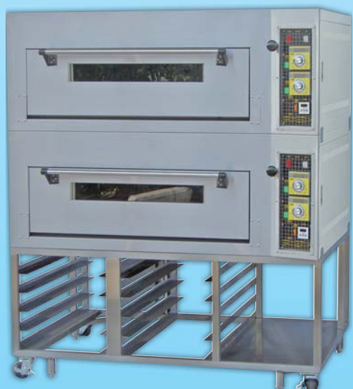
二層四盤電子 瓦斯烤箱

外徑 External Size W116×D67×H175cm 內徑 Baking Chamber Size W76×D48×H20cm 瓦斯消耗量 Gas Consumption 0.6KG/H