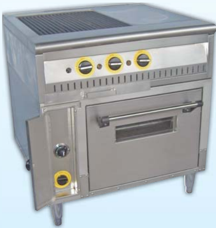
瓦斯西餐爐 Gas Range 外徑 External Size W92xD75xH80/95cm 內徑 Baking Chamber Size W48xD52xH30cm