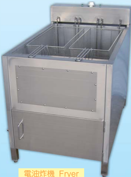
電油炸機 Fryer 外徑 External Size W60xD72xH80cm 用電量 Power Consumption 6KW