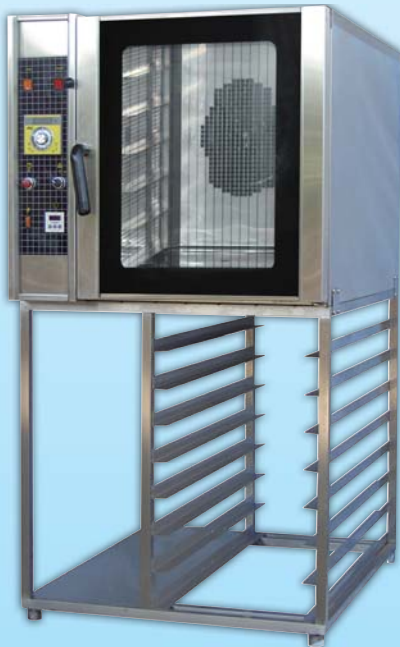
電熱型 熱風烤箱 TYT106L-E

外徑 External Size W78xD103xH156cm 內徑 Baking Chamber Size W41xD61xH56cm 用電量 Power Consumption 8.8KW/11.2KW