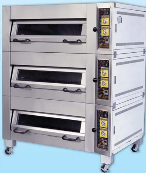
上掀式三層 六盤電烤箱 TYE306U-E 外徑 External Size W140xD104xH175cm 內徑 Baking Chamber Size W97xD76xH20cm 用電量 Power Consumption 18KW