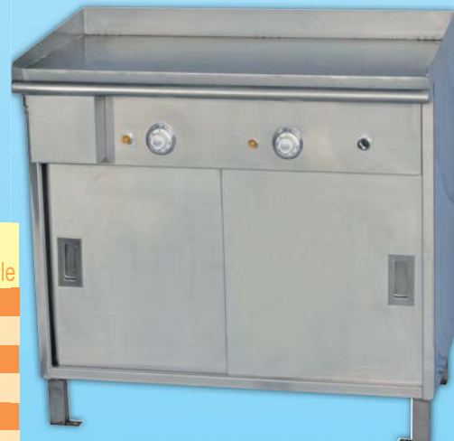
電煎板 Electric Griddle 外徑 External Size W70xD70xH38cm 用電量 Power Consumption 5KW