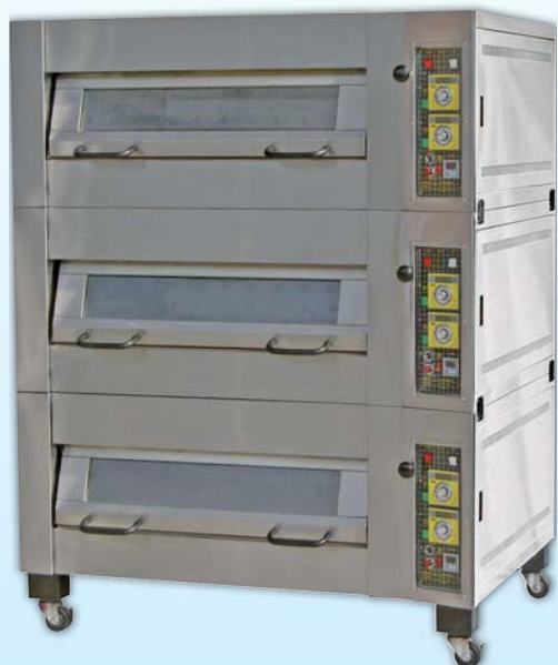
上掀式三層九盤 電子瓦斯烤箱