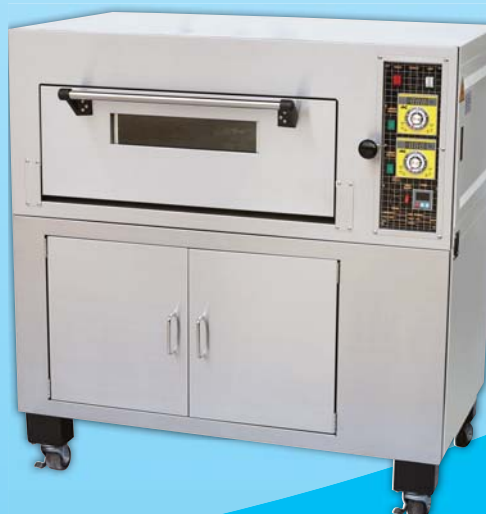
一層二盤電子 瓦斯烤箱

外徑 External Size W140×D100×H168cm 內徑 Baking Chamber Size W97×D76×H20cm 瓦斯消耗量 Gas Consumption 0.7KG/H