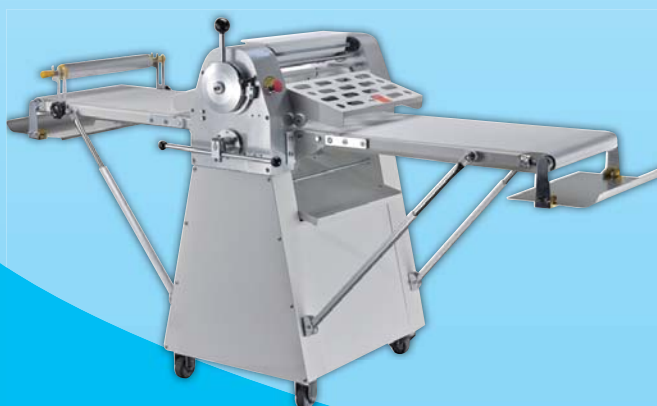
立地型丹麥 壓麵機 TYR520B 外徑 External Size W210×D85×H110cm 輸送帶尺寸 Baking Chamber Size 51.5×200cm 用電量 Power Consumption 1/2HP