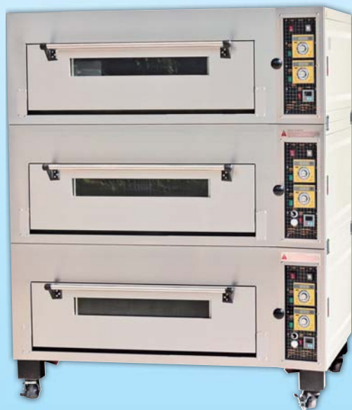
三層六盤 電烤箱 TYE306-E 外徑 External Size W140×D100×H165cm 內徑 Baking Chamber Size W97×D76×H20cm 用電量 Power Consumption 18KW