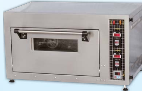
桌上型電烤箱 TYE005-E 外徑 External Size W79×D50×H43cm 內徑 Baking Chamber Size W54.5×D36.5×H21.5cm 用電量 Power Consumption 2.5KW