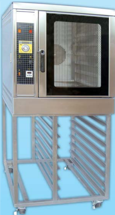
瓦斯型 熱風烤箱 TYTG106L-E 外徑 External Size W78xD103xH174cm 內徑 Baking Chamber Size W41xD61xH56cm 用電量 Power Consumption 1HP