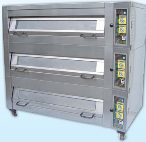
上掀式三層 九盤電烤箱 TYE309U-E 外徑 External Size W189xD104xH175cm 內徑 Baking Chamber Size W146xD76xH20cm 用電量 Power Consumption 27KW