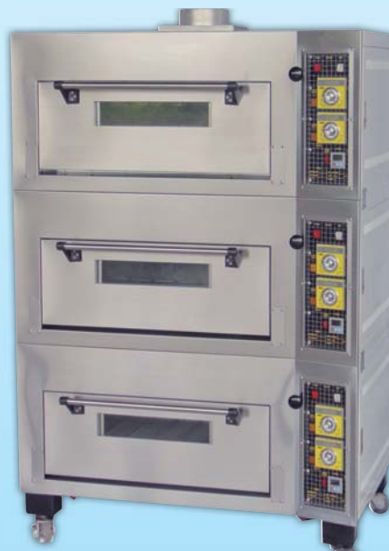
三層三盤電子 瓦斯烤箱

外徑 External Size W140×D100×H175cm 內徑 Baking Chamber Size W97×D76×H20cm 瓦斯消耗量 Gas Consumption 0.8KG/H