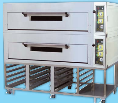
二層六盤 電烤箱 TYE206L-M 外徑 External Size W189xD100xH158cm 內徑 Baking Chamber Size W146xD76xH20cm 用電量 Power Consumption 18KW