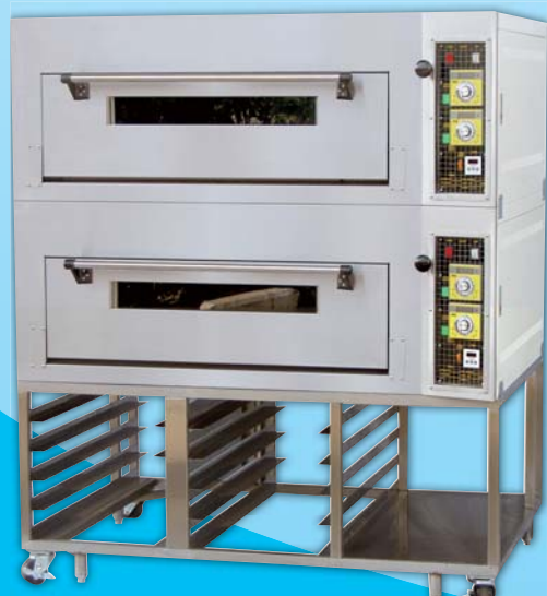
二層四盤 電烤箱 TYE204L-E 外徑 External Size W140×D100×H158cm 內徑 Baking Chamber Size W97×D76×H20cm 用電量 Power Consumption 12KW