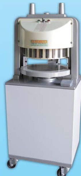
麵團分割機 TYSE36 外徑 External Size W41×D51×H103cm 用電量 Power Consumption 1/4HP