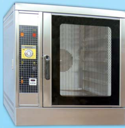
瓦斯型 熱風烤箱 TYTG106-E 外徑 External Size W78xD103xH86cm 內徑 Baking Chamber Size W41xD61xH56cm 用電量 Power Consumption 1HP