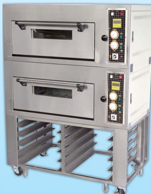
二層二盤 電烤箱 TYE202L-M 外徑 External Size W116×D67×H158cm 內徑 Baking Chamber Size W76×D48×H20cm 用電量 Power Consumption 7KW