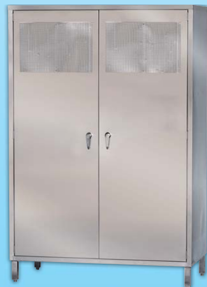
不銹鋼櫃 外徑 External Size W120xD65xH180cm