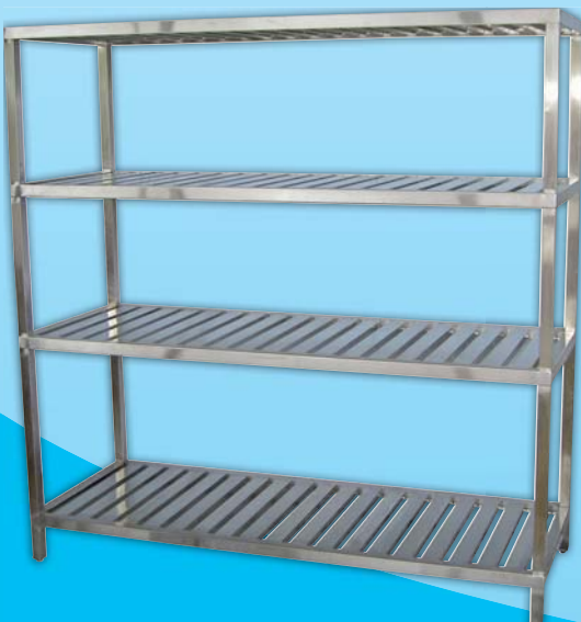
置物架 Rack 外徑 External Size W120xD60xH200cm W150xD60xH200cm W180xD60xH200cm