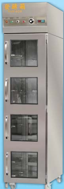
四門噴霧 發酵箱 TYF408A-M 外徑 External Size W55×D99×H224cm 用電量 Power Consumption 1.6KW