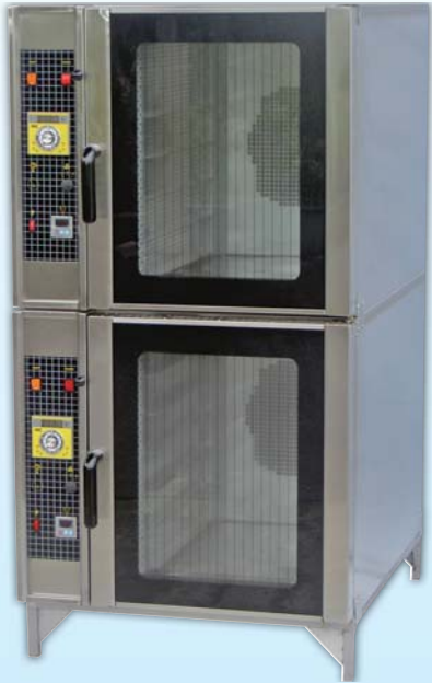
雙層電熱型 熱風烤箱 TYET212-E

外徑 External Size W78xD103xH152cm 內徑 Baking Chamber Size W41xD61xH56cm 用電量 Power Consumption 13.2KW/18KW