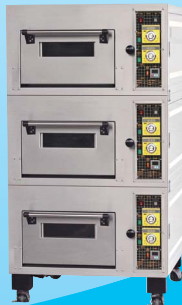
三層三盤 電烤箱 TYE303-E 外徑 External Size W87×D95×H165cm 內徑 Baking Chamber Size W48×D76×H20cm 用電量 Power Consumption 10.5KW