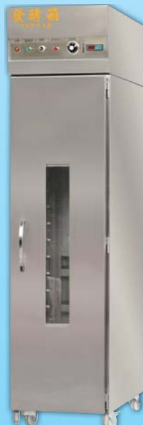
單門噴霧 發酵箱 TYF118A-M 外徑 External Size W55×D99×H224cm 用電量 Power Consumption 1.6KW