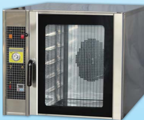
電熱型 熱風烤箱 TYT106-E

外徑 External Size W78xD103xH156cm 內徑 Baking Chamber Size W41xD61xH56cm 用電量 Power Consumption 6.6KW/9KW