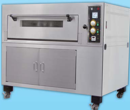
一層二盤 電烤箱 TYE102K-M 外徑 External Size W140×D100×H122cm 內徑 Baking Chamber Size W97×D76×H20cm 用電量 Power Consumption 6KW