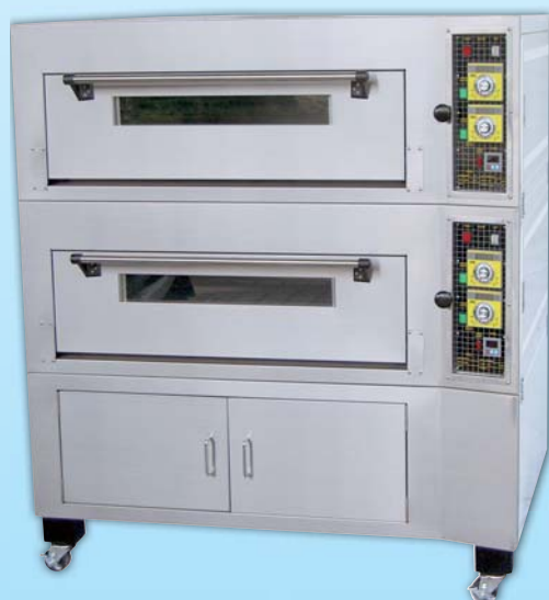
二層四盤 電烤箱 TYE204K-E 外徑 External Size W140×D100×H158cm 內徑 Baking Chamber Size W97×D76×H20cm 用電量 Power Consumption 12KW