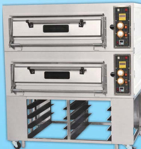
二層四盤 電烤箱 TYE204CL-M 外徑 External Size W140×D95×H158cm 內徑 Baking Chamber Size W97×D76×H20cm 用電量 Power Consumption 12KW