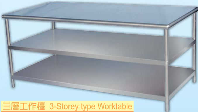
三層工作檯 3-Storey type Worktable 外徑 External Size 90x180x85cm